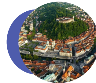
卢布尔雅那都会区（斯洛文尼亚）

卢布尔雅那都会区分享了 智能工厂 、数字创新中心、绿色转型及人工智能领域的最佳实践。