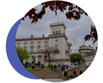
别尔斯克-比亚瓦（波兰）

作为 数字创新中心 ，比尔斯科-比亚瓦已启动多个项目，以推进 工业4.0 相关活动。其中包括