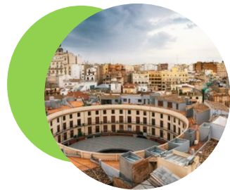
瓦伦西亚大区（西班牙）

瓦伦西亚大区在 数字化 、创业生态系统、动态创新及科研生态系统中展现出诸多优势。众多初创企业专注于人工智能、大数据、 物联网 和云计算。