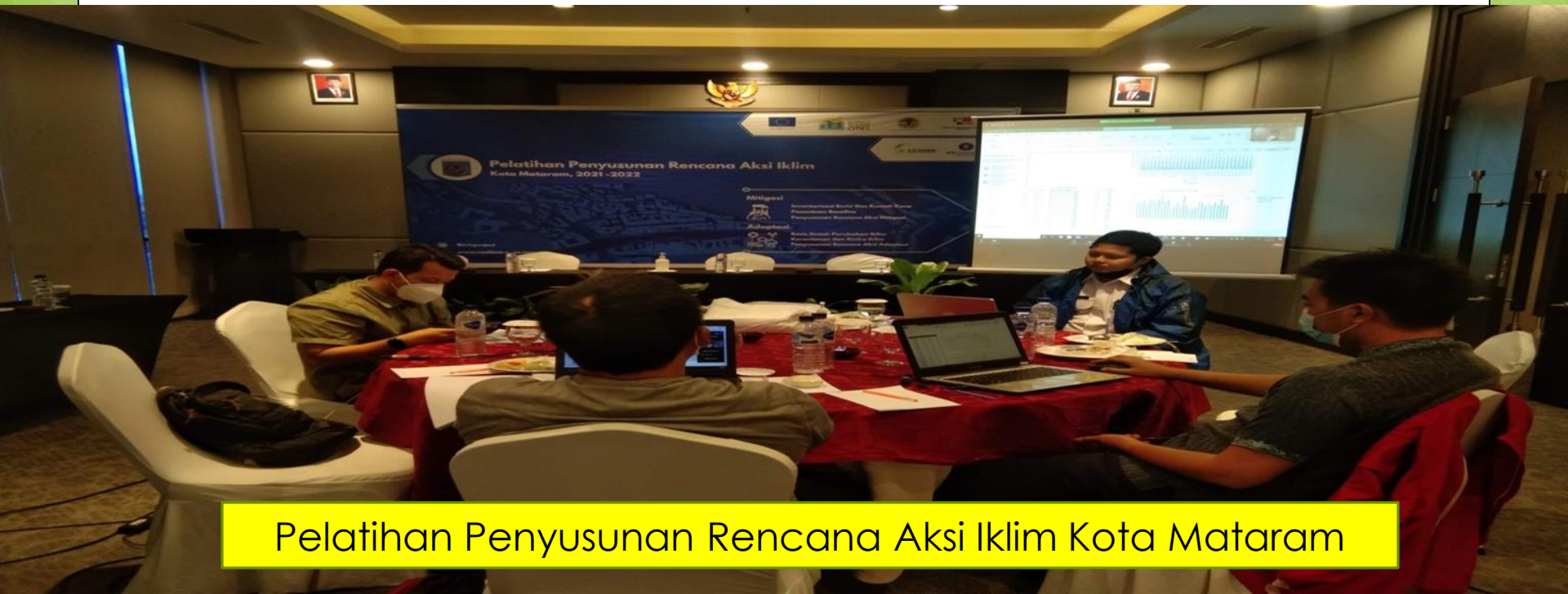
Pelatihan Penyusunan Rencana Aksi Iklim Kota Mataram