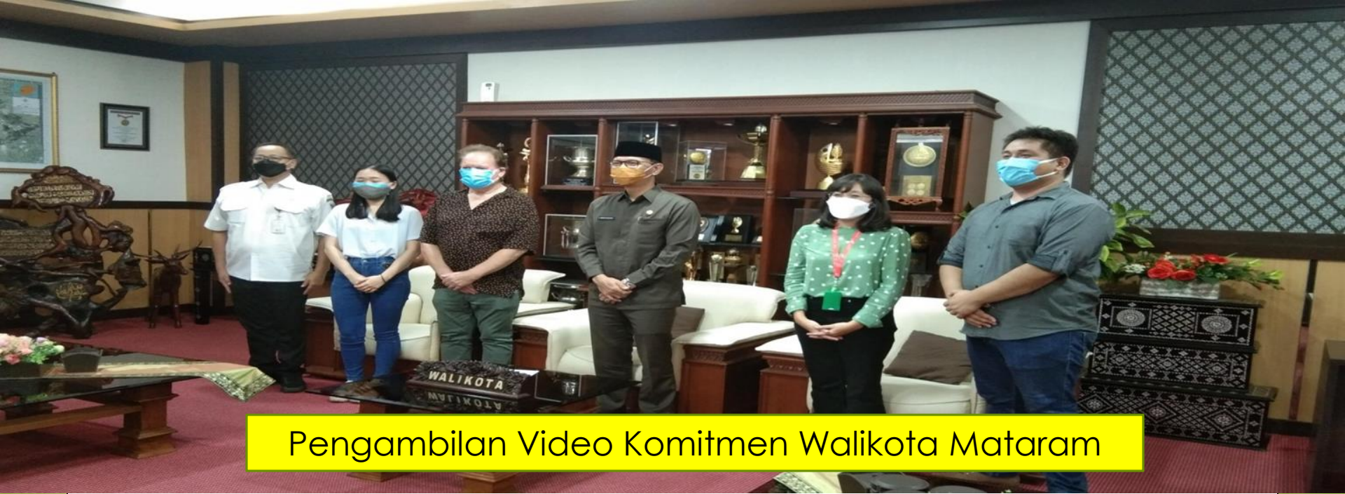
Pengambilan Video Komitmen Walikota Mataram