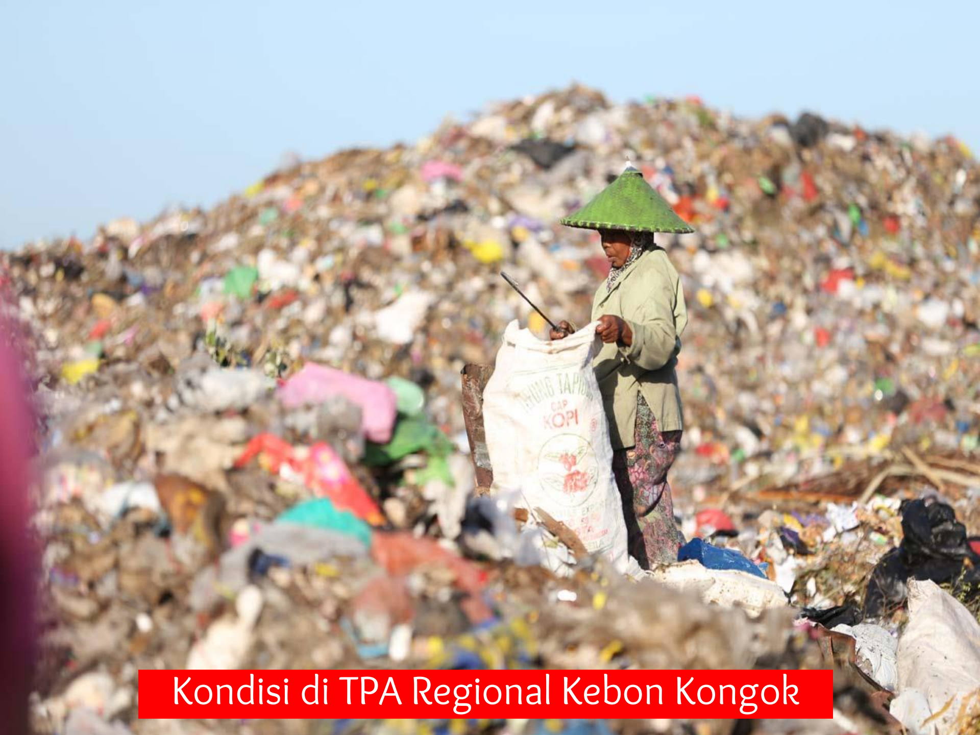
Kondisi di TPA Regional Kebon Kongok